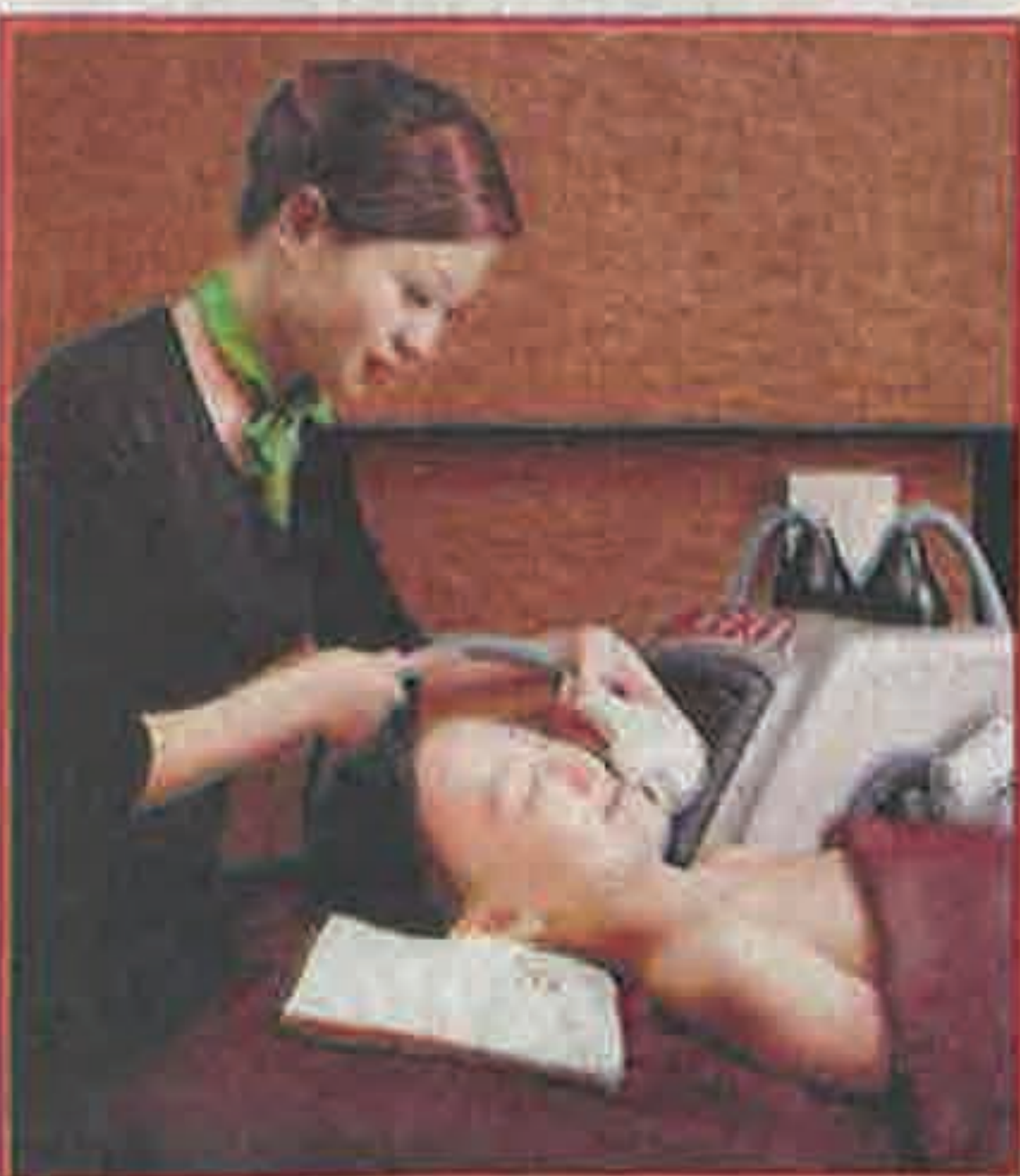
专业护肤让Bioskin引以为荣。

都说自信的男人最有魅力。有了这项新服务，男士们从此有望抚平大肚臍，拥抱健康；更棒的身材也意味更有“本钱”展现腹肌，穿上衣服更是帅气无比；在社交及工作场合，无往不利！